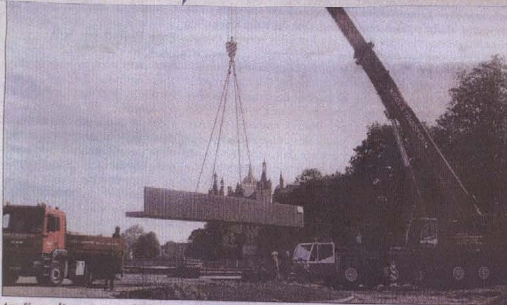
Am Kran die erste von drei Fußgängerbrücken auf dem BUGA-Gelände.

➤ Seite 22 Formel 1: Die größten Unwägbarkeiten