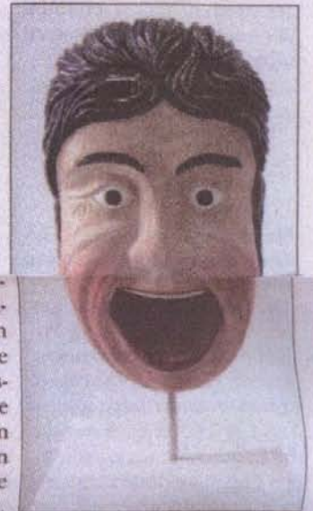
Der „Kleiekotzer“ – ein altes Symbol der Müllerzunft – war früher am Mehl- oder Beutelkasten angebracht.

Im letzten Raum „steht“ natürlich auch jemand zur Verabschiedung der Gäste aus nah und fern bereit – eine Nachbildung des Kleiekotzers. Früher an Mehl- oder Beutelkasten angebracht, in dem das gemahlene Korn gesiebt wurde, dienten seine unheimlichen, dämonischen Gesichtszüge der Abschreckung von bösen Geistern. Er wurde durch einen feinen, schlauchartigen Beutel geleitet, der ständig in Bewegung war. Das feine Mehl rieselte durch die Poren des Beutels. Die grobere Kleie fiel nach unten und der Kleiekotzer spuckte sie aus. Im „flour art museum“ ist der Mühlenschutzegeist als Glücksbringer in Aktion, der den Besuchern den Müllergruß „Glück zu!“ mit auf den Weg